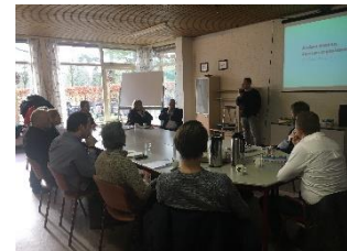
Anders denken, doen én organiseren

Hoe zorgen we voor duurzame huisvesting voor kwetsbare groepen en leefbare wijken voor iedereen? Op zo'n manier dat het aangenaam en veilig is voor omwonenden, professionals en ons vastgoed.